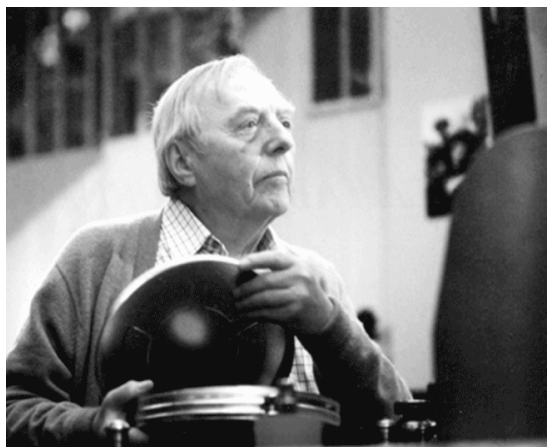
1980 - LE FILM de Paul GRIMAULT