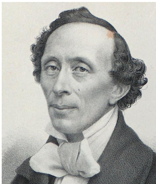
1845 - LE CONTE de Hans Christian ANDERSEN