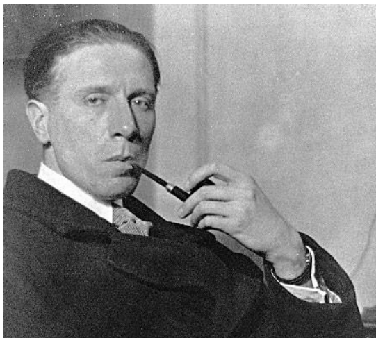
Henri-Pierre ROCHÉ - LE LIVRE 1953