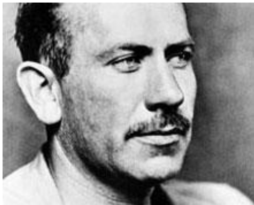
John STEINBECK - LE LIVRE 1939